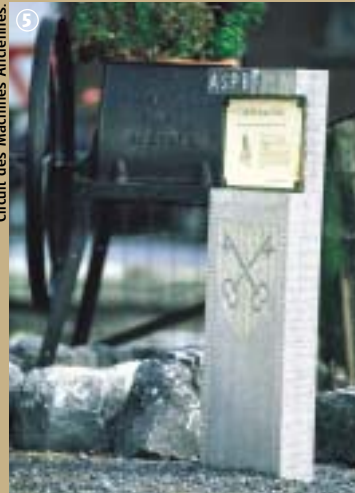
Circuit des Machines Anciennes.

Petit panorama des machines-outils qui, il n'y a pas si longtemps, régissaient la vie des agriculteurs. La herse, tout d'abord, brise les mottes de terre ramenant en surface les mauvaises herbes. Le tarare sépare les graines des impuretés en trois lots : les petites impuretés (petites graines, terre) ; les impuretés grossières (cailloux, épis cassés...) et le bon grain. L'envoleuse de pommes de terre déterre, à l'aide d'un soc, les plants de pommes de terre. Pour